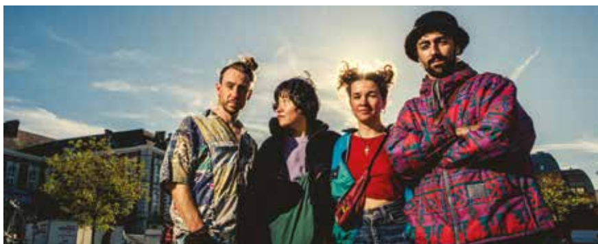
Jazz Week