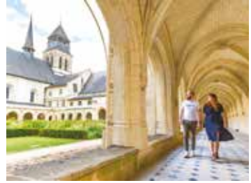
Abbaye Royale de Fontevraud

Les secrets comme les jardins donnent de la saveur à l'existence par la poésie qu'ils y apportent. Je ne pourrai pas n'en citer qu'un !