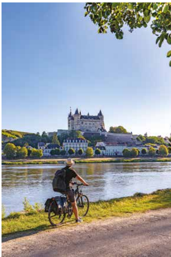
Château de Saumur