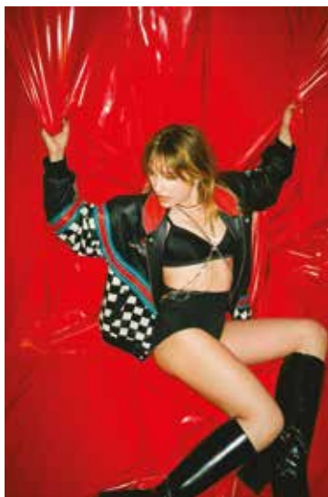
103 © Pierre-Angé Caratelli